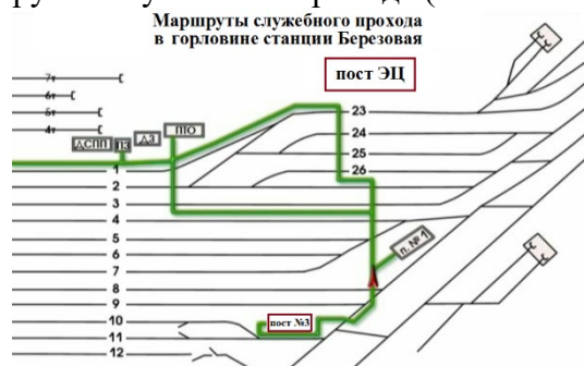
Рис.1 Маршруты служебного прохода для передвижения работников в южной горловине станции

Передвижение работников ж.д. транспорта по станции Березовая в южной горловине, должно осуществляется согласно маршрутам служебного прохода (выписка из ТРА), смотри Рис.1.