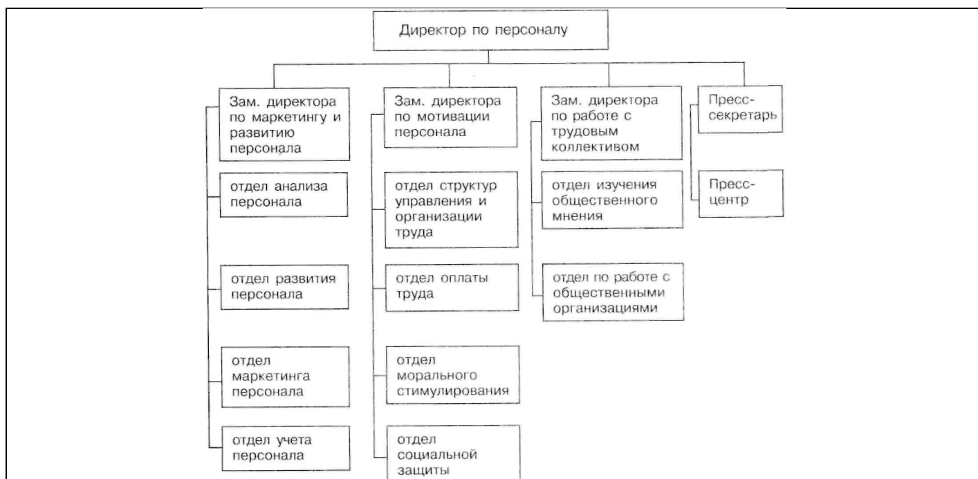
Рис. 1. Схема организационной структуры дирекции по персоналу

Рассмотрим кратко эти основные направления.