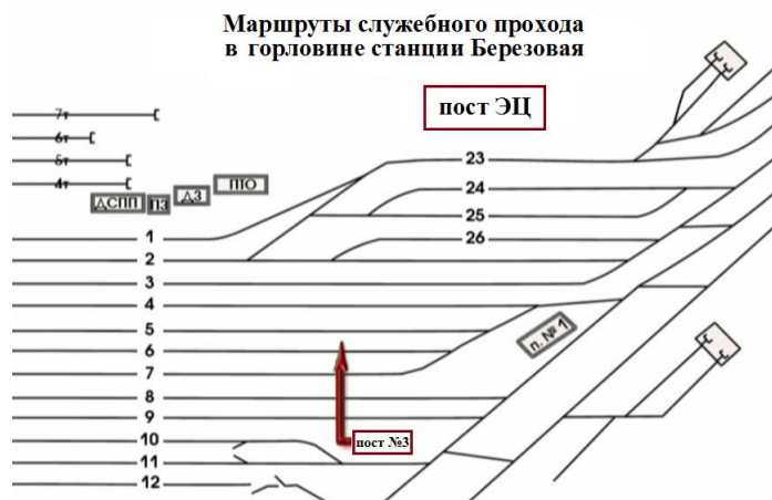
Рис.2 Маршрут передвижения сигнальщика Виноградовой А.П. в южной горловине станции

Сигнальщик, в виду свободности путей от подвижного состава по 7С, 8С и 9С пути, устремилась к стоящему по 5С пути поезду №3003 по кратчайшему пути, игнорируя служебные проходы, смотри Рис.2 ( нарушение условий передвижения по ж.д. путям работника станции к месту работ ). Произвела закрепление поезда №3003 с юга двумя тормозными башмаками №345 и №344, после чего, устремилась обратным путем к посту №3 ( повторное нарушение условий передвижения по ж.д. путям работника станции ).