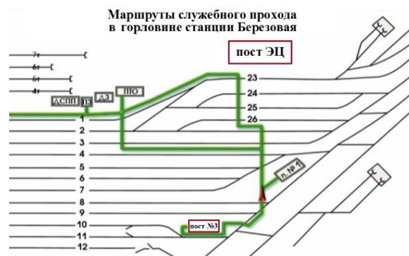
Рис.1 Маршруты служебного прохода для передвижения работников в южной горловине станции

Передвижение работников ж.д. транспорта по станции Березовая в южной горловине, должно осуществляться согласно маршрутам служебного прохода (выписка из ТРА), смотри Рис.1.