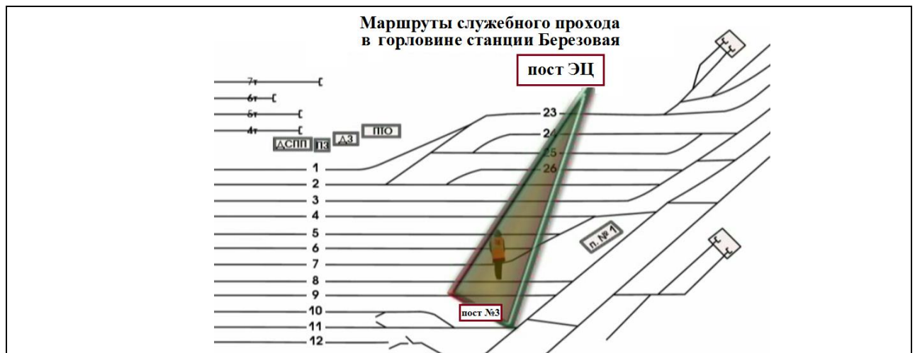
Рис.3 Визуальный контроль во время работы маневрового диспетчера

После закрепления тормозными башмаками поезда №3003 по 5С пути, вернувшись на пост №3, сигнальником об этом было доложено ДСП.