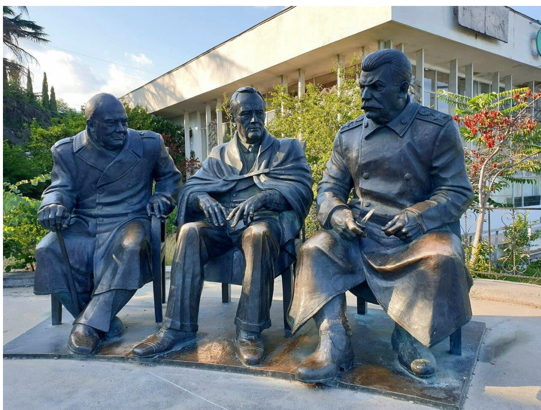
Памятник лидерам «Большой тройки» (Ялта, Россия)