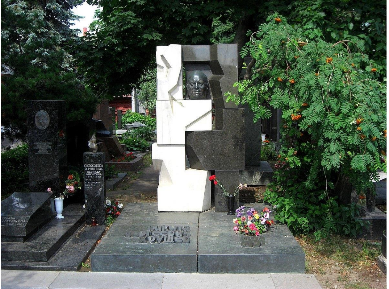
Памятник на могиле Хрущёва на Новодевичьем кладбище в Москве. Скульптор Эрнст Неизвестный.