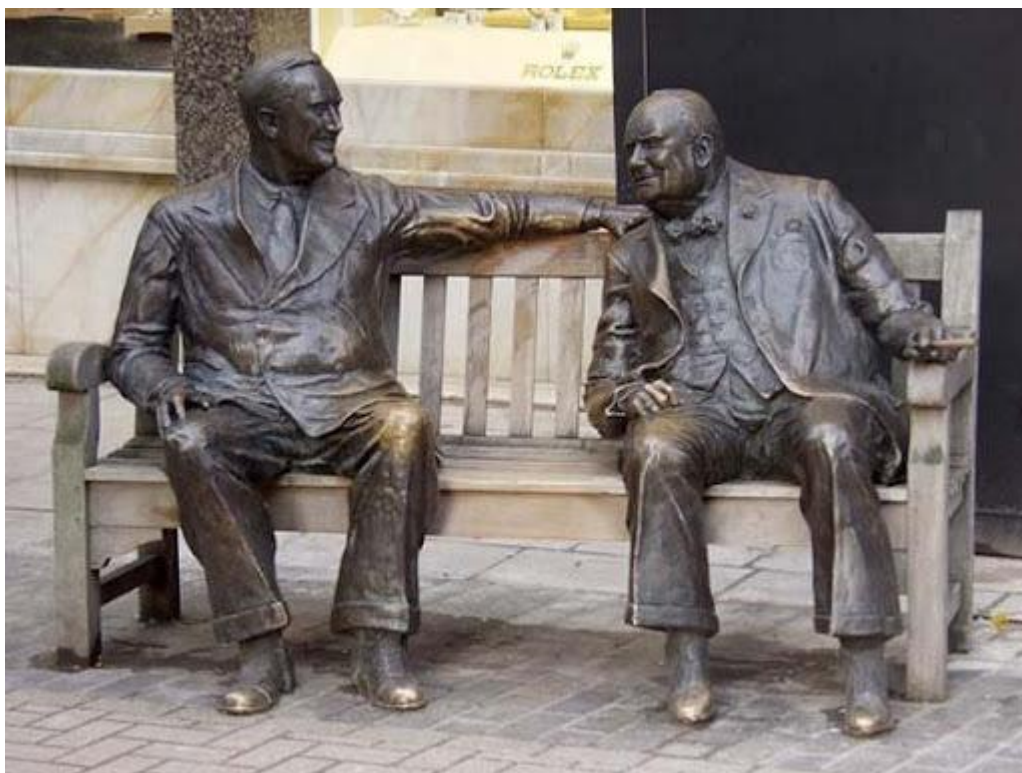
Скульптура «Союзники» (Лондон, Великобритания)