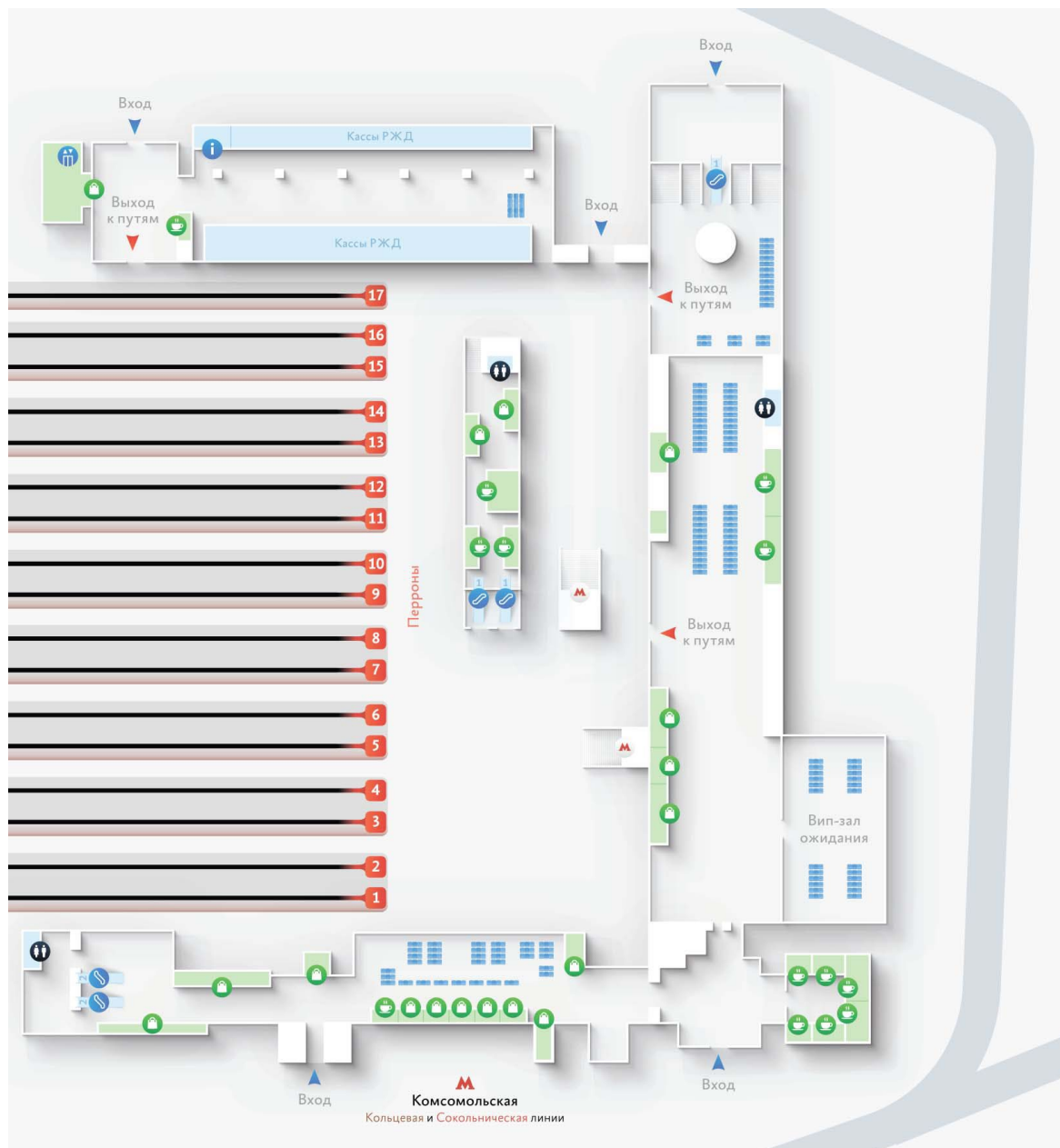
Рисунок 1.1 – Схема Казанского вокзала

Для заданного вокзального комплекса разрабатывается ряд мероприятий и выбирается маршрут беспрепятственного следования маломобильного пассажира согласно СТО РЖД 03.001-2014.