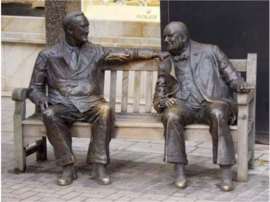
Скульптура «Союзники» (Лондон, Великобритания)