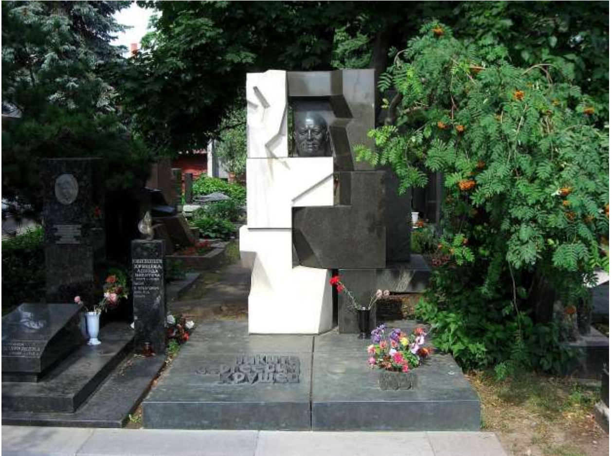
Памятник на могиле Хрущёва на Новодевичьем кладбище в Москве. Скульптор Эрнст Неизвестный.