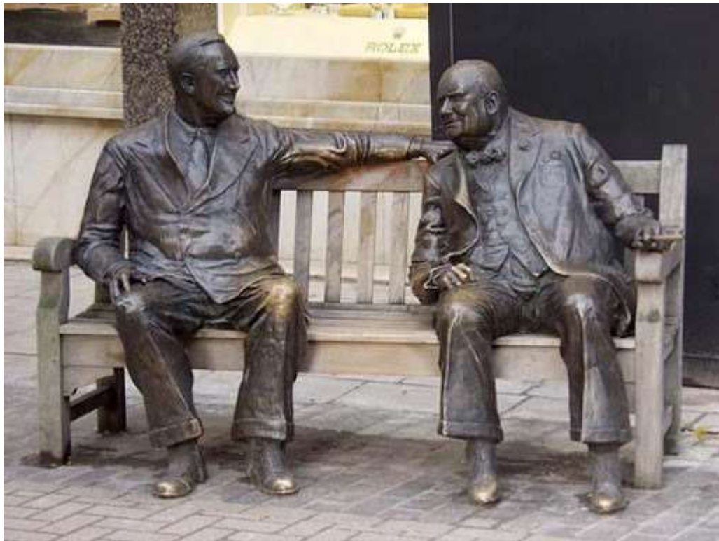
Скульптура «Союзники» (Лондон, Великобритания)