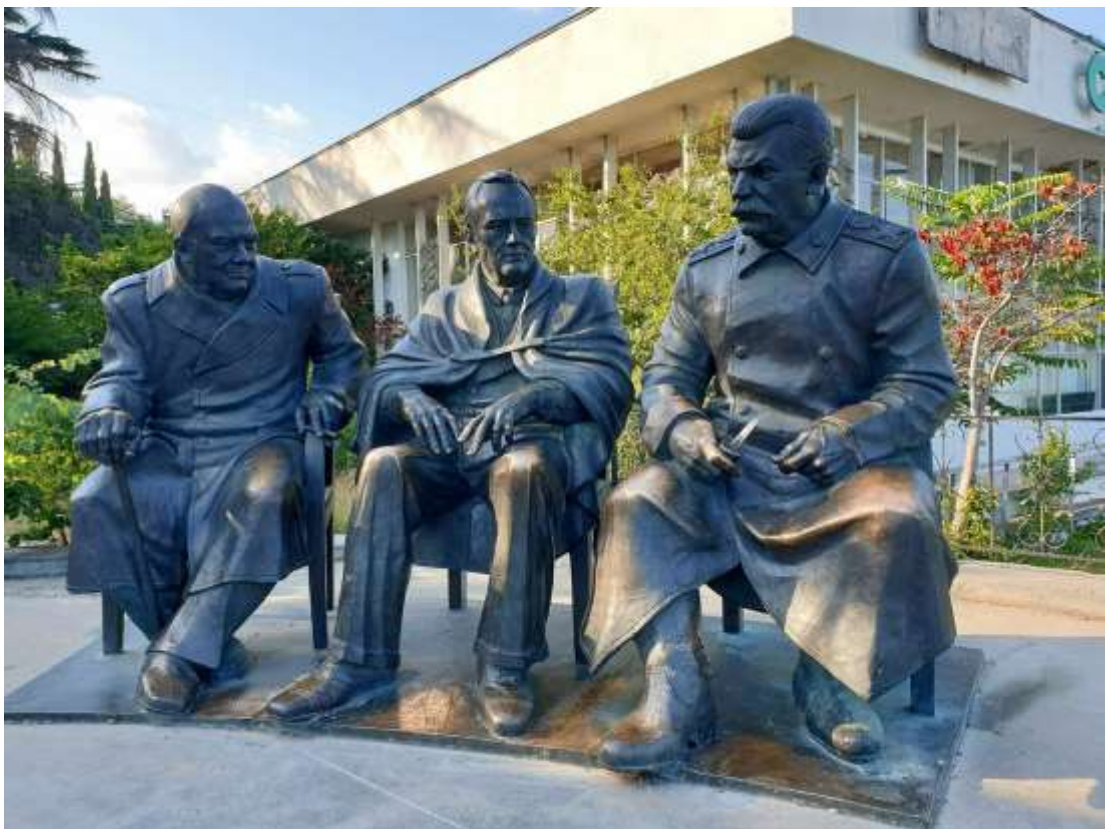
Памятник лидерам «Большой тройки» (Ялта, Россия)