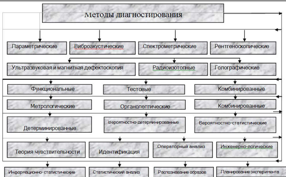
Рис 2. Выбор методов диагностирования

ПК-6.1 Принимает управленческие решения на основе интеллектуального анализа показаний средств диагностики локомотивов, с использованием современных цифровых технологий