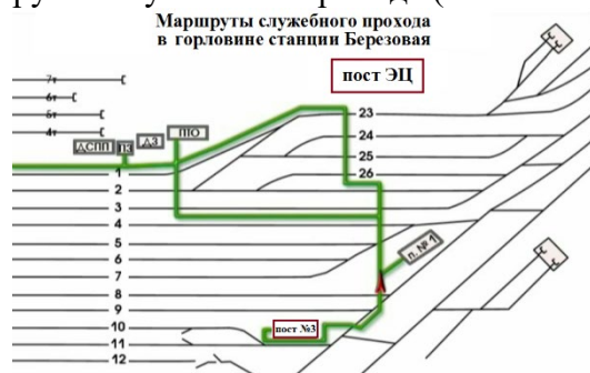
Рис.1 Маршруты служебного прохода для передвижения работников в южной горловине станции

Передвижение работников ж.д. транспорта по станции Березовая в южной горловине, должно осуществляется согласно маршрутам служебного прохода (выписка из ТРА), смотри Рис.1.