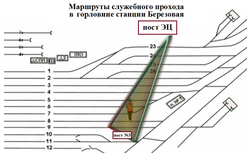
Рис.3 Визуальный контроль во время работы маневрового диспетчера